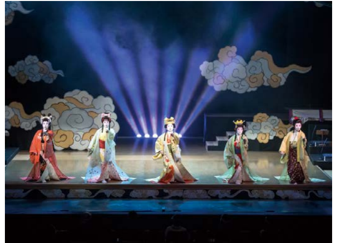
「創作舞踊劇 名古屋城天守物語」12月12日、13日 名古屋市芸術創造センター