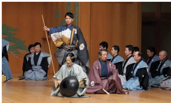
淡交会別会 能「隅田川」 11月3日 名古屋能楽堂

感染が一時減少傾向を見せ、定員に対して100%の客席使用が認められた秋、「瑞鳳澄依りサイトル コロナ禍の中で」