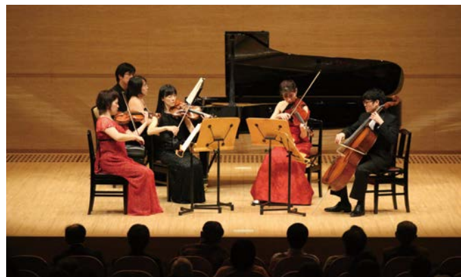
ブラームスのピアノ五重奏曲を演奏する室内楽集団アンディアーモ 2月24日 電気文化会館 ザ・コンサートホール

音楽・演奏会でもご多分に漏れず、この1年の最大の話題はコロナ禍だった。年初から始まった感染は急速に拡大し、演奏会は次々に中止・延期された。3～5月のまるまる3カ月間、演奏会はほぼ姿を消した。6月以降、少しずつ再開し始めたものの、主催者や演奏会場による厳重な感染予防対策、客席数制限が続いた。ようやく、名古屋フィルハーモニー交響楽団（以下「名フィル」）など一部が年末に客席制限措置を撤廃したが、感染予防をはじめとする開催経費の増大、チケット収入の減少など難問は山積。苦境の中で「音楽の灯を消すな」と関係者がこぞって必死に頑張っている。