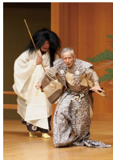
御洒落名匠狂言会 狂言「武悪」 9月27日 名古屋能楽堂