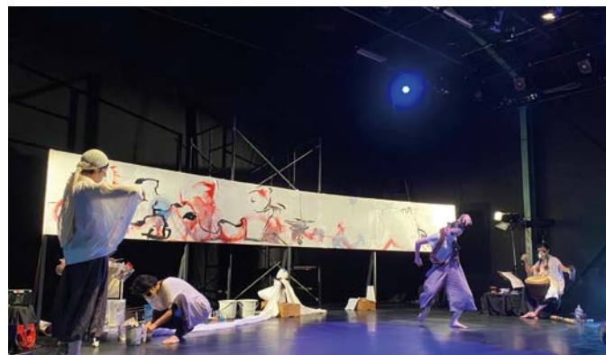
ナビプロフトで公演された、公開図画工作『すずめ、うれしめ』

一度目の緊急事態宣言解除後は、劇場にも動きがあった。太白区のナビプロフトは7月、仮面を活かした三人芝居『ハハチチ』やシンポジウムを含む複合イベントを敢行。中でも、美術と舞踊のライブパフォーマンス『すずめ、うれしめ』には舞台芸術本来の祈りの精神がうかがえた。大劇場では御園座が8月に再開。特に錦秋御園座歌舞伎が強く印象に残る。初日を拝見すると、幕が下りても拍手が止まない。通常10月は顔見世興行だが、この時はコロナ禍のせいもあってか、小規模な座組。それを寂しく思った常連客も少なくないはずなのに、そんな感傷すら吹き飛ばすほど熱い拍手が送られたのだ。名古屋の観客は感情を露わにしないといわれがちだが、人々がどれほど舞台を待ち望んでいたのか知る瞬間となった。