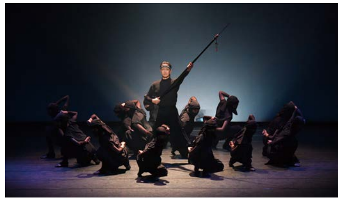
三代舞踊団「忍者～服部半蔵」 12月13日 名古屋市青少年文化センター

ジャズダンスの三代舞踊団が創設三十周年を記念し、第三十回クリスマス定期公演を敢行(12月13日)。「忍者～服部半蔵」で、使命に殉じる者たちの精神美を表現した。