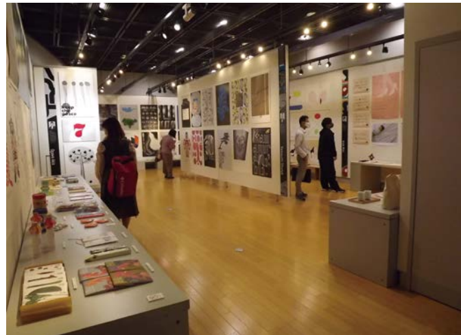
「7 GRAPHIC DESIGNERS IN NAGOYA 2020」展での会場風景

コロナ禍が収束しないまま始まった2021年。展覧会の在り方や文化芸術の必要性が、あらためて問われる一年となるだろう。